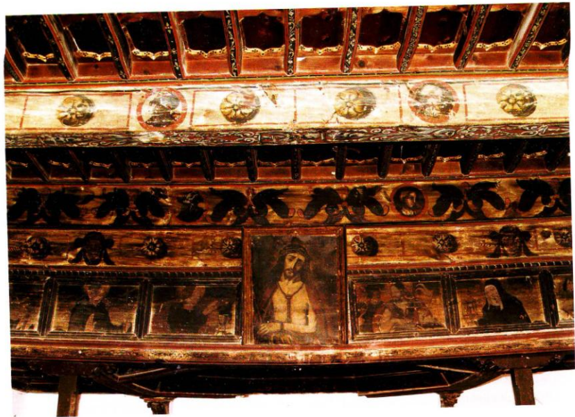
Baza. Colegio de la Presentación. Alfarje. Detalle. Siglo XVI.

sobre el cancel de entrada, de tradición mudéjar. El testero contuvo un retablo barroco, realizado en 1680 por Manuel Caro. El claustro se ordena mediante doble pórtico de arcos de medio punto sobre pilares octogonales, todo ello en ladrillo. Sin duda, el espacio más interesante del conjunto lo constituye la capilla de la enfermería –habilitada en la actualidad como biblioteca escolar–, que luce una de las techumbres mudéjares más excepcionales de la provincia de Granada. Se compone de un alfarje de doble orden de vigas con labor de menado, chillas de ocho y alfardones de perfil de arco conopial, y verduguillos pintados. Todo el entramado de jaldetas